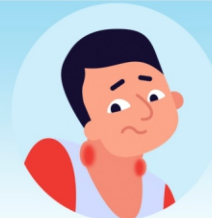
Увеличение шейных лимфатических узлов

Возможные осложнения: обычно краснуха у детей протекает довольно легко, но возможно в редких случаях, как и при кори, развитие энцефалита .